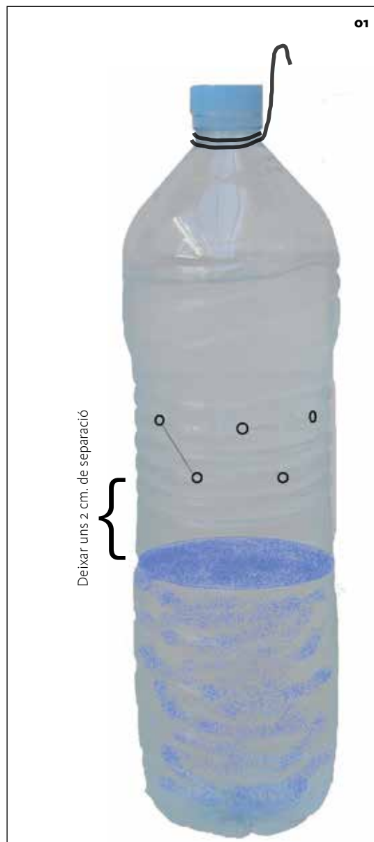
01. La trampa tipus Olipe proposada per a la captura massiva de la mosca suzuki.

Recomanem instal·lar la captura massiva perimetral en el període que va des de caiguda de pètals fins al canvi a color palla. En el moment de color palla convé que la captura massiva estigui instal·lada ja que és el moment en què la cirera comença a ser susceptible a la suzuki.