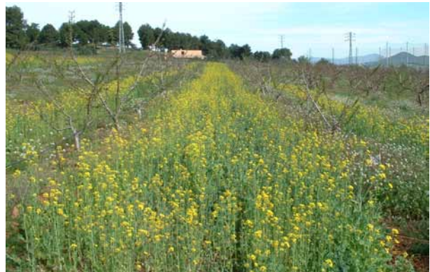
Foto 2: Cultiu de bràssiques en cultiu de fruiters.

Pel que fa a les matèries orgàniques útils per a la biofumigació del sòl, s'ha trobat que generalment qualsevol matèria orgànica pot actuar com a biofumigant. La seva eficàcia depèn principalment del tipus de matèria orgànica aportada, de la dosi i del mètode d'aplicació. En aquest sentit, hi ha tres grups principals de matèries orgàniques biofumigants: fems frescos, residus d'indústries agràries transformadores i cultius de bràssiques, que s'acaben incorporant al sòl al final del cultiu.