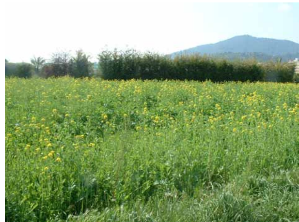
Foto 1: Cultiu de nap farratger per biofumigació.

Malauradament, la introducció dels adobs químics propicià l'oblit de la importància que té la fertilitat del sòl i la seva fertilització orgànica en l'autogestió de la sanitat dels agrosistemes. I així és com avui dia els patògens del sòl han esdevingut un dels problemes principals en la productivitat dels cultius, la qual cosa causa pèrdues milionàries any rere any, i obliga en agricultura convencional a l'aplicació de cada vegada més quantitat de desinfectants químics del sòl per poder-hi fer front. Un d'aquests desinfectants químics, el més conegut, és el bromur de metil (BM), prohibit des de l'any 2005. Les raons principals de la seva prohibició foren que entre el 50 i el 95% del BM aplicat a terra passava en forma d'emissions gasoses a l'estratosfera, on allibera àtoms de brom que reaccionen amb l'ozó i altres molècules estables que contenen clor, que dona lloc a una reacció en cadena que contribueix a la disminució de la capa d'ozó (Thomas 1997, en A. Bello et al. ). Gràcies a la prohibició d'ús d'aquest producte químic, la recerca d'alternatives per a la desinfecció dels sòls s'ha accelerat enormement.