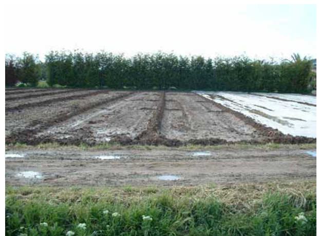
Foto 8: Camp d'assaig on s'ha realitzat una comparativa entre una biofumigació o una biosolarització (biofumigació + solarització).

Si bé l'objectiu principal de la biofumigació és el control de patògens del sòl, els efectes que indueix en el sòl i en la disponibilitat de nutrients pel cultiu posterior han de ser tinguts en compte per a un correcte pla de fertilització dels cultius. De totes maneres, resulta remarcable la importància d'establir programes de fertilització que considerin les característiques no només del biofumigant, sinó també del sòl on s'aplica.